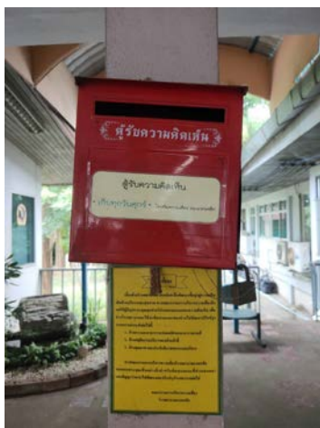
รูปภาพ ๑ กล่องรับความคิดเห็น