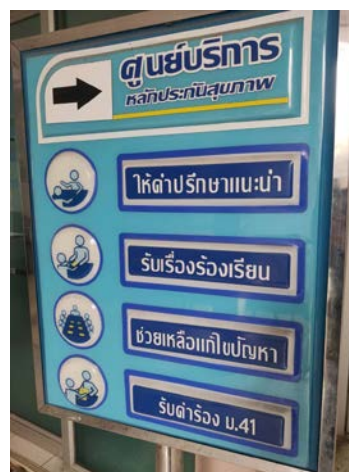
รูปที่ ๒ ป้ายศูนย์รับเรื่องร้องเรียน